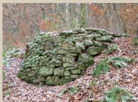
Relikt der hannöverschen Südbahn - Signalpodest