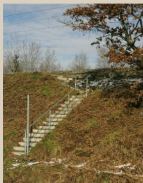
Vorbild Dammtreppe