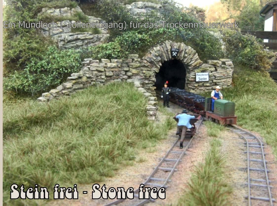
Ein Mundloch (Stolleneingang) für das Trockenmauerwerk