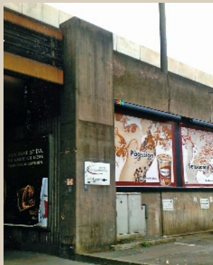
Steinfrei auch für die Epochen 5 und 6 - Hbf. Hannover, Ausgang Raschplatz

packe-vollen Ankündigungspipeline, ist aber zu 80% fertig und wird durch den Güterschuppen Göttingen Ost und ein Toilettengebäude ergänzt werden.