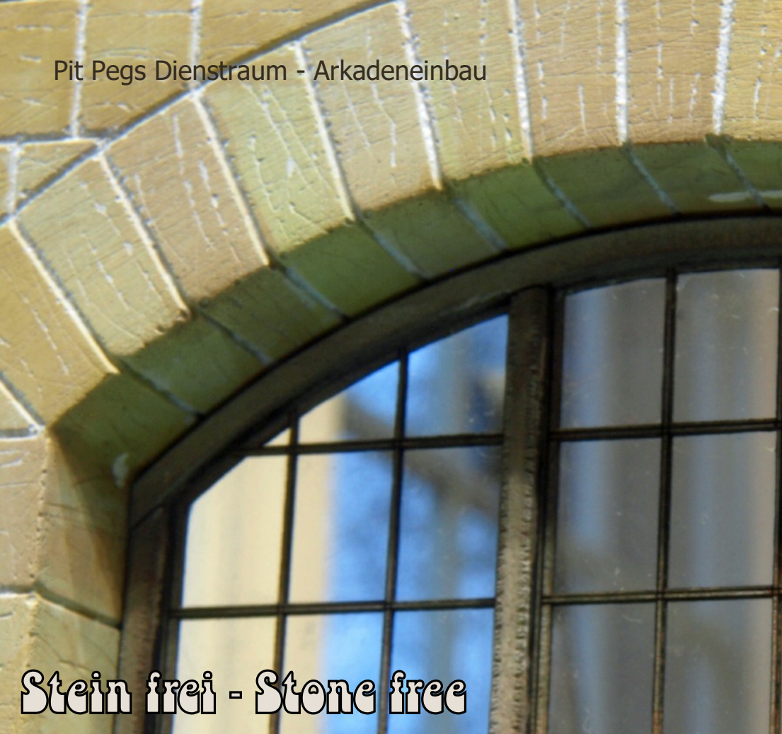
Pit Pegs Dienstraum - Arkadeneinbau