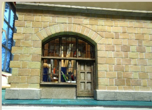
Der neue Dienstraum. Es fehlen noch die Gipsteile für Treppenstufe und Fensterbrüstung.