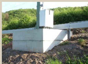
Normteile an der Nord-Süd-strecke.