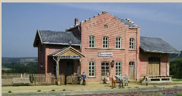
Wird mit zahlreichen Verbesserungen wiederaufgelegt - der Bahnhof Oberscheden für HO.