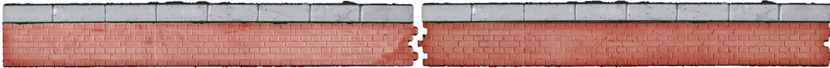
Endstücke (paarweise) V3025

Ziegelbahnsteig mit Natursteinabdeckung, h = 38cm ü. SO