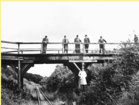
Viehüberführung Wöllmershausen Spur 0 und H0