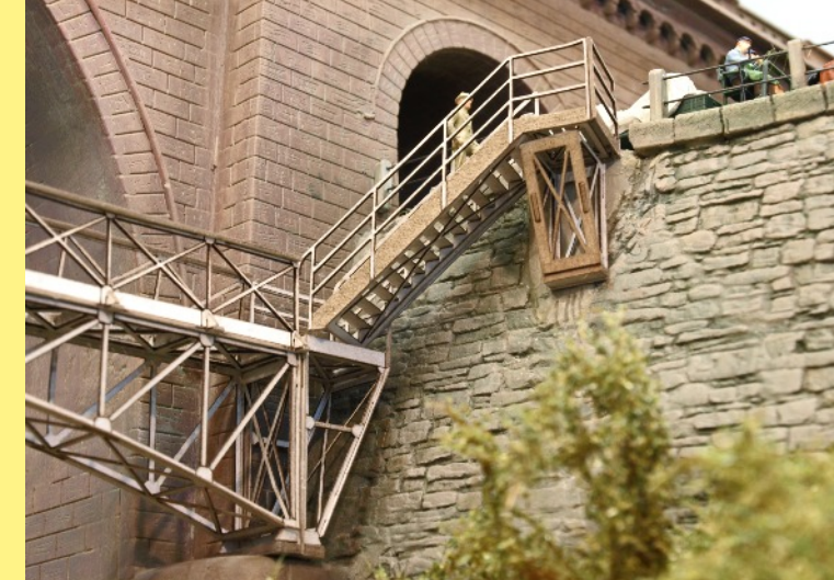
Abgang zum Fußgängersteg V1248