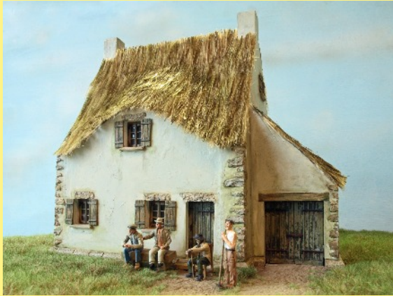
Haus am See Spur 0