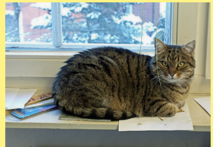
Unser Werkstattkater Tricky Dicky an seinem Lieblingsplätzchen