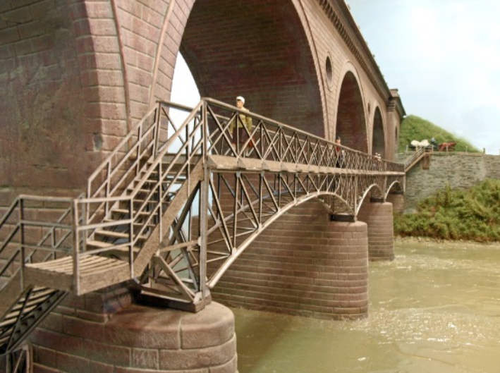
Aufgang zum Fußgängersteg V1247