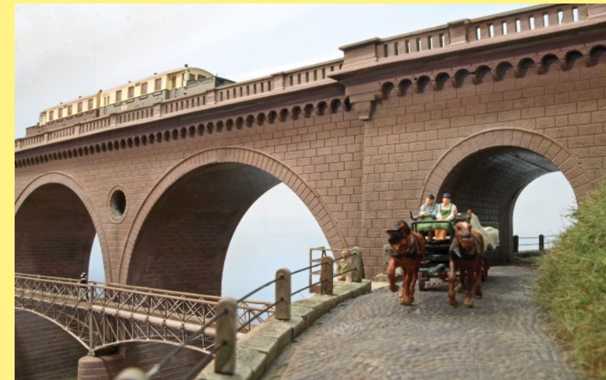
Straßendurchlass im Widerlager

Maße: 3 Bögen L = 1114mm, 6 Bögen L = 1780mm Höhe zwischen UK Pfeiler und OK Fahrbahn H = 243mm