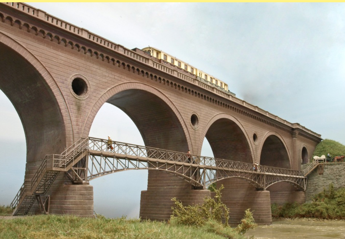
Viadukt über die Werra (V1240 Grundset mit drei Bögen und V1241 Ergänzung mit einem Bogen)

Der Bausatz ist, wie das Original der Hannoverschen Südbahn von 1856 landschaftsprägend und gestalterisch opulent. Schon die Ausmaße sind für Modellbahnverhältnisse ungewöhnlich. Dazu kommen noch aufwendig und sehr plastisch ausgebildete Details, wie maßstäbliche Strompfeiler mit Vorköpfen, Rundbogenfriese mit Deckgesimsen, durchbrochene Brückenaugen und Gewölbebögen sind mit Archivolten versehen. Die aufwendigen Brüstung besteht aus Pfostenreihen und Pfeilern. Ein Widerlager ist mit einem Straßendurchlaß versehen.