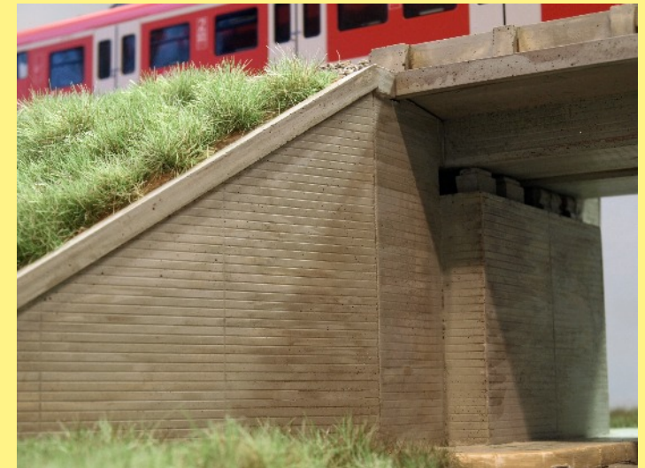
Die Unterführung Laubacher Berg für Spur 0 und H0