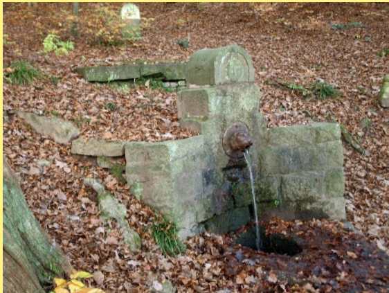
Katerquelle Spur 0 und H0