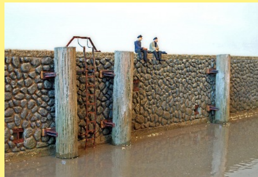
Sittin' on the dock of the bay...