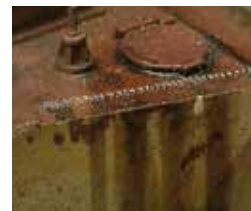
Art. 73815 Engine Grime / Suciedad de Motor

Las reposiciones de combustible se efectuaron en el campo de batalla utilizando cubos, embudos improvisados y secciones de manguera. El combustible se derramaba sin remedio dejando rastros de manchas.