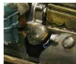
Art. 73816 Diesel Stains / Manchas de Diesel

Sobre las superficies de un bloque motor, en su compartimento o incluso en zonas donde se había acumulado restos de carburante o aceite se acumula una suciedad mezcla del polvo de un matiz grisáceo.