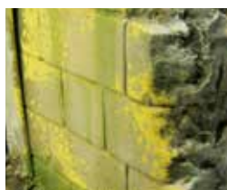
Art. 73828 Wet Effects / Efectos de Humedad

Los líquenes y el moho son efectos de la intemperie. Este producto reproduce el color y la textura moteado de liquen generado sobre piedras y muros. Se aplica con un pincel fino, o bien con esponja para reproducir el moteado.