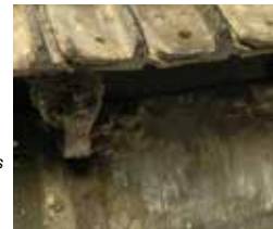
Art. 73814 Fuel Stains / Manchas de Combustible

Las manchas de lubricantes se encuentran en los motores y alrededor de los elementos móviles de los vehículos. Su tono y acabado brillante procuran un acabado realista. Se aplica en forma de salpicaduras, goterones o trazas.