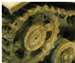
Art. 73827 Moss and Lichen / Musgo y Liqueen

Mud and Grass Effect reproduce la textura que resulta del tránsito de los vehículos sobre hierba y barro. Contiene trazas de vegetación aplastada. Se aplica sobre ruedas o cadenas de los vehículos de combate y sobre dioramas.