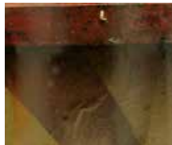
Art. 73825 Crushed Grass / Hierba Aplastada

La lluvia arrastra el polvo y la suciedad de forma que ésta deja rastros sobre las superficies de vehículos y objetos, en forma de depósitos en hendiduras o relieves.