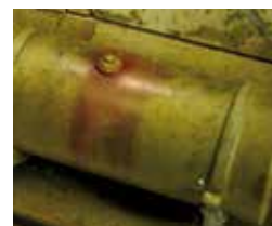
Art. 73817 Petrol Spills / Salpicaduras de Petróleo

Las manchas de carburante tipo gasolina no tienen el mismo matiz que los de gasoil. Con Diesel Stains se reproduce el tono anaranjado y transparente del gasoil representando los rastros y trazas en los vehículos.