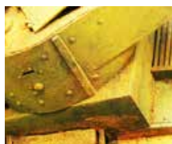
Art. 73822 Slimy Grime Dark / Suciedad Húmeda Oscura

Óxido oscuro que reproduce los tonos anaranjados y el aspecto áspero de un vehículo quemado y abandonado, un techo metálico o un coche en un desguace. Se aplica a pincel o aerógrafo con aguja de 0.4 y presión alta.